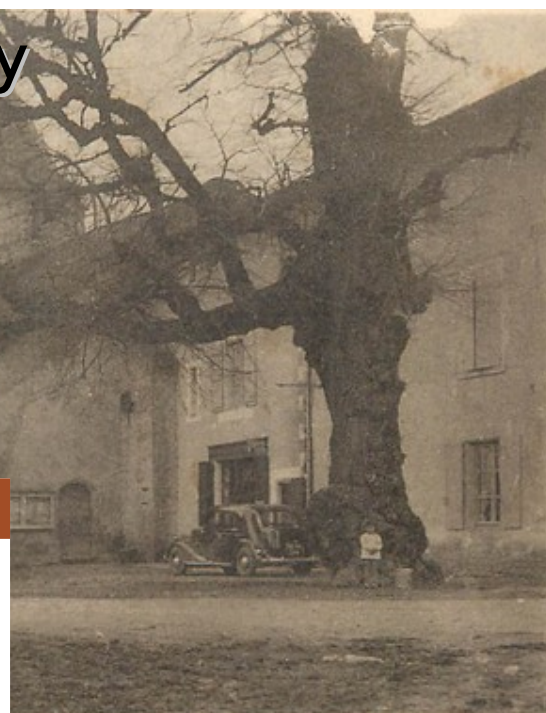
l'arbre séculaire du temps de Henri IV

Cependant en l'absence d'arrêté officiel, le site n'est pas déclassé malgré les demandes des élus locaux.