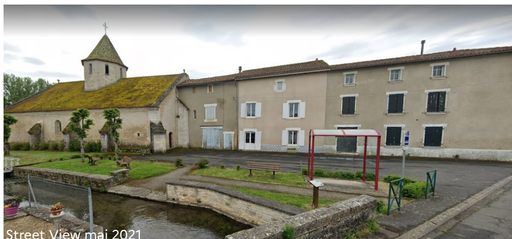
Street View mai 2021

La placette devant la façade de l'église présente un aménagement paysager autour du ruisseau le Cornac, avec des surfaces en herbe, des haies, des bancs, un alignement de tilleuls et un arrêt bus (à la place du tilleul). Dans le prolongement du volume de l'église et jusqu'à la rue, un ensemble de maisons mitoyennes typiques ferme la placette au sud. Entre l'aménagement et ce bâti un vaste espace goudronné jusqu'aux façades sert de parking.